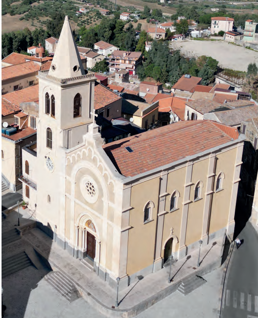
La chiesa di S. Nicola

Questa in breve la storia della iconostasi e del vima di questa madre chiesa di S. Nicolò, che ho potuto stendere sulla scorta dei documenti esistenti in