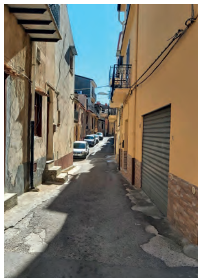
Via N. Di Marco